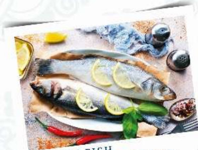
PEIXES | FISH Peixe Fresco todos os dias | Fresh Fish every day