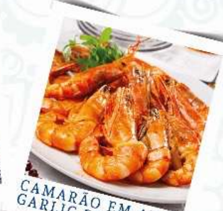
CAMARÃO EM ALHO GARLIC PRAWN