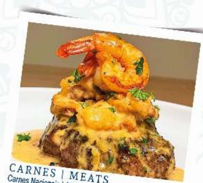
CARNES | MEATS Carnes Nacionais | National Meats